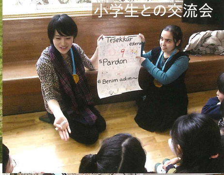
小学生との交流会