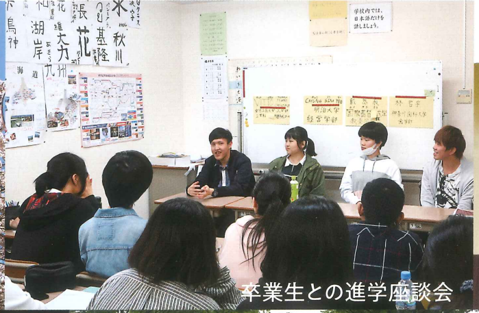
卒業生との進学座談会