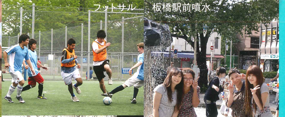
フットサル 板橋駅前噴水