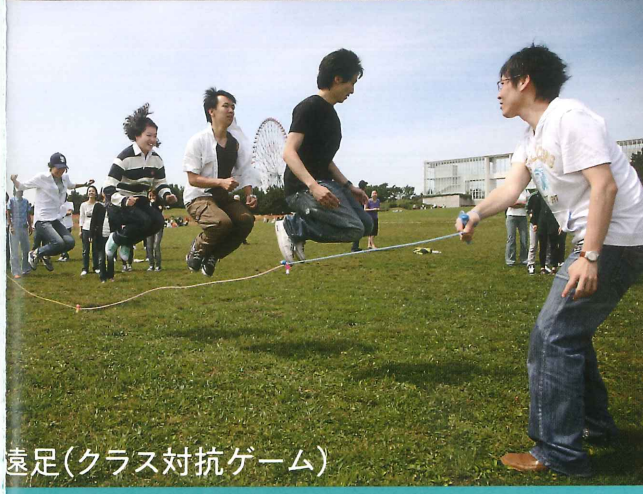
遠足(クラス対抗ゲーム)