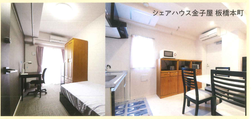
シェアハウス金子屋 板橋本町