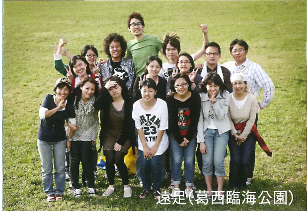
遠足(葛西臨海公園)