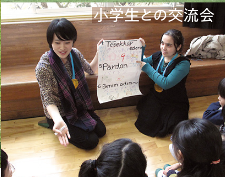
小学生との交流会