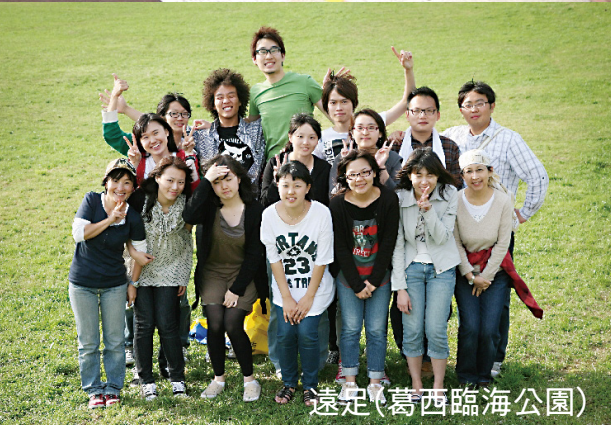
遠足(葛西臨海公園)