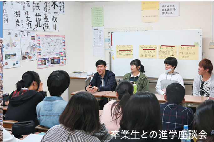
卒業生との進学座談会