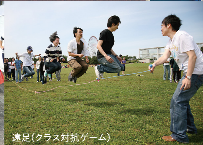
遠足(クラス対抗ゲーム)