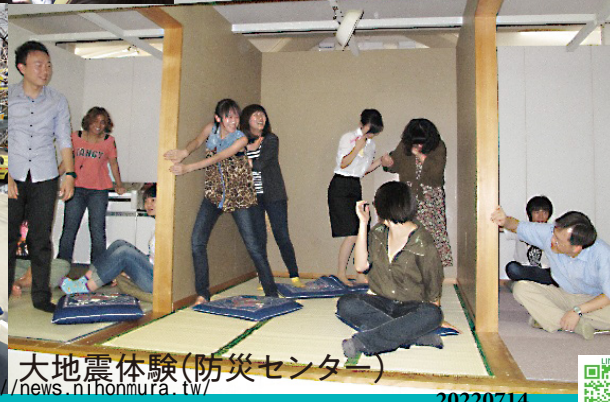
大地震体験(防災センター)