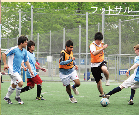
フットサル 板橋駅前噴水