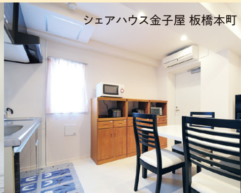
シェアハウス金子屋 板橋本町